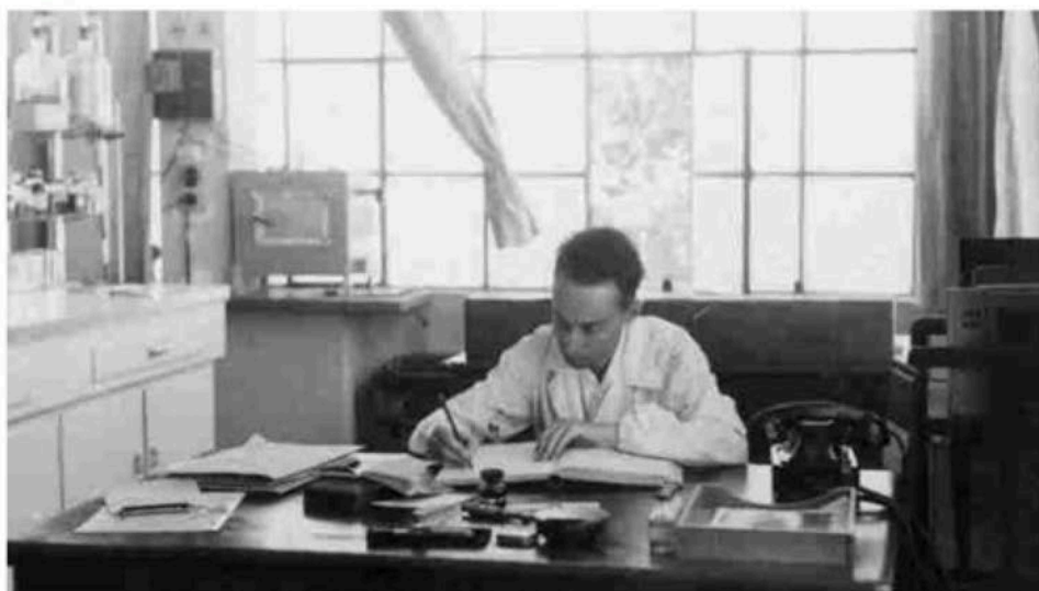
Primo Levi giovane chimico al lavoro alla sua scrivania e, a fianco in un ritratto da fanciullo